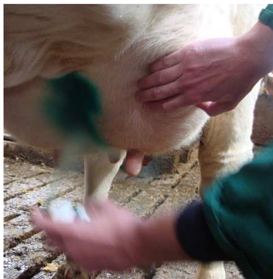
Foto 5. Il colore aggiunto a Repiderma indica chiaramente la zona trattata.